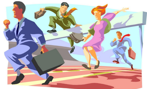
Vecinos disgustados con la Justicia